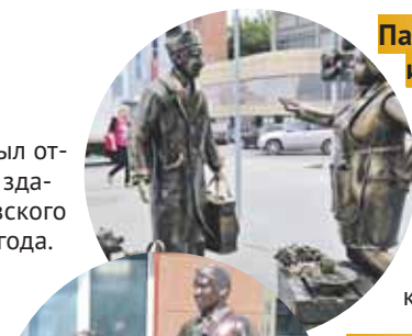
Памятник покупателю и продавцу

Был открыт на перекрёстке улиц Сибревкома и Серебренниковской в 2006 году и стал первым памятником светофору в России. Как раз на этом месте был установлен в конце 1940-х годов один из первых светофоров города.