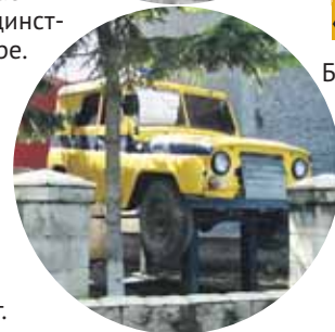
Памятник милиционерскому «УАЗику» в Тогучине

Установлен на Комсомольской площади к 270-летию города, которое отмечалось в 1987 году. 40-тонный камень был водружён на постамент без всякой предварительной обработки — таким, каким его достали из карьера.