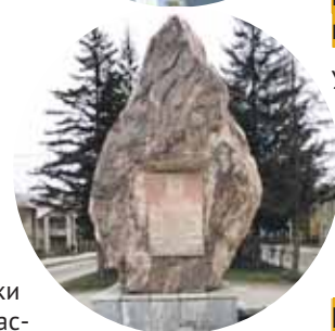
Памятник известняку в Искитиме

Установлен в Новосибирске, в сквере на улице Народной, открылся 30 сентября 2014 года. Это первый в России памятник, посвящённый сразу всем творцам атомной отрасли.