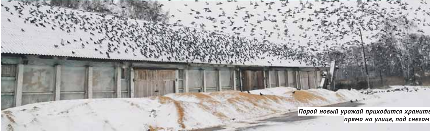
Порой новый урожай приходится хранить прямо на улице, под снегом.

В 2008 году Россия впервые в истории преодолела рубеж в 100 миллионов тонн зерна — было собрано 107 млн. Прошлый год подарил нам рекорд — 120,6 млн тонн, в этом году он был превзойдён: общий валовый сбор по стране превысил 130 миллионов тонн. Но оказалось, что к рекордам мы не готовы. Особенно — регионы Сибири, в которых не знают, что делать с излишками зерна. В предыдущие годы Новосибирская область стабильно вывозила за пределы региона около 800 тысяч тонн излишков, но в этом их накопилось порядка 1,1–1,2 млн тонн. Элеваторы затарены, государственные закупочные интервенции, которые могут стать спасением, пока не открыты, и продать зерно даже по низкой цене крестьяне не могут. Все вагоны, находящиеся в собственности у РЖД и крупнейших операторов, заняты на вывозе зерна из европейской части России в черноморские порты.